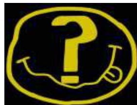
LOS DON NADIE